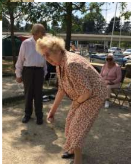
Pétanque au Vengeron