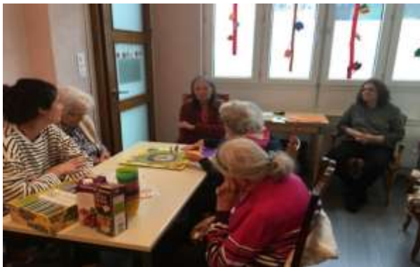
Les dames du vendredi autour d'un jeu de société

Comme les années précédentes, nos activités sont proposées pour le plaisir de nos hôtes. Elles peuvent être routinières ou réclamées par les bénéficiaires eux-mêmes ou bien encore organisées d'une façon ponctuelle selon l'envie et les facultés de chacun.