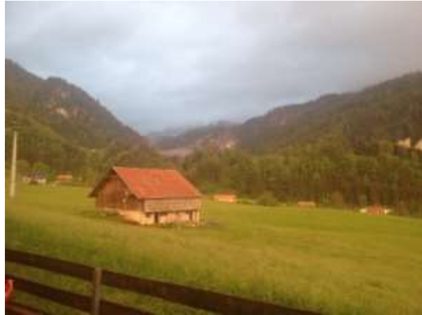
Vues depuis nos terrasses, à Charmey