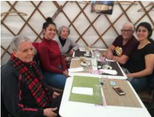
Dernière journée avec une fondue de la yourte au Grand-Saconnex