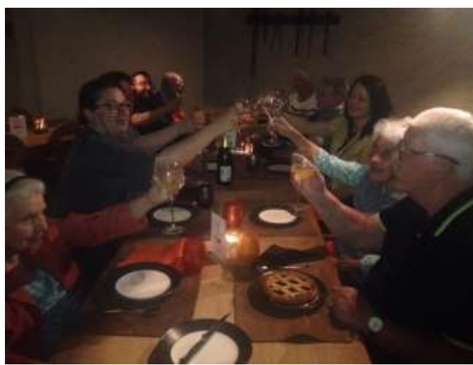
Souper à Charmey : « Santé ! »