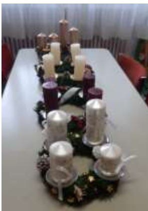
Confection de couronnes avec les bénévoles d'une entreprise genevoise

Novembre, c'est également le temps de préparer l'Avent et ainsi de confectionner de belles couronnes, qui seront toutes vendues.