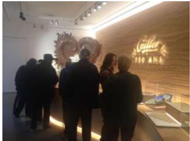
Visite du Musée Cailler, maison du Chocolat à Broc, avec un parcours didactique et une présentation des divers produits...que l'on peut goûter