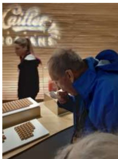
Après un bon repas, on hume avec délectation les odeurs de chocolat...avant de le mettre en bouche !