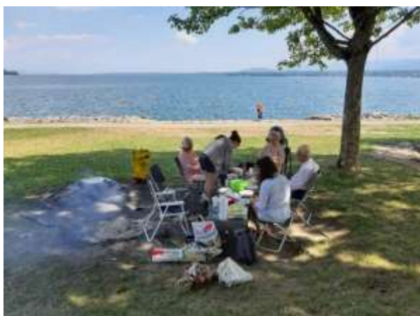
Pique-nique au bord du lac pour un anniversaire