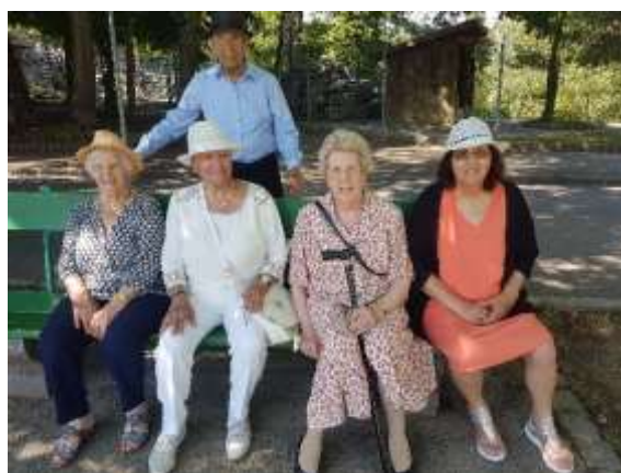
Bois de la Bâtie