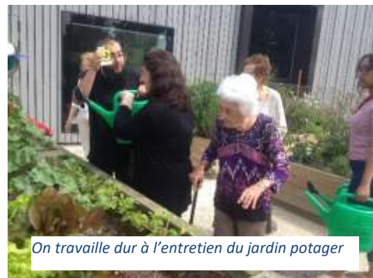
On travaille dur à l'entretien du jardin potager